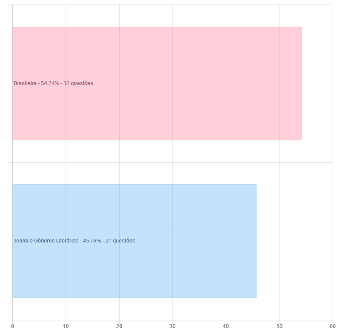
Gráfico 2 – Cobrança de Literatura no vestibular UECE

Fonte: Elabore Provas – Estatísticas. Disponível em: https://tinyurl.com/y44adcfv .