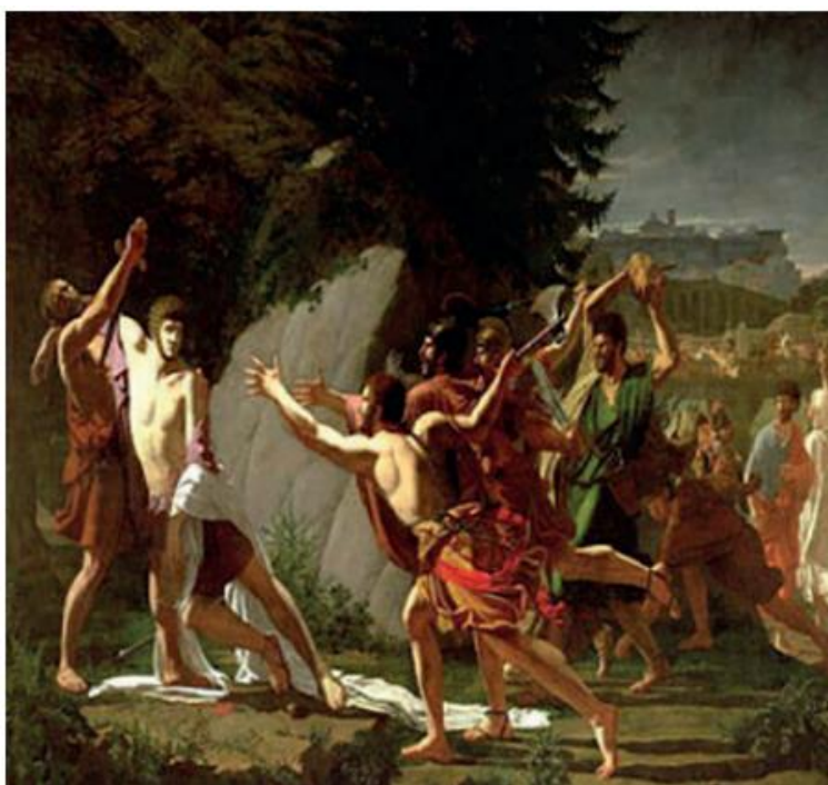
A morte de Caio Graco, tela de François Topino Lebrun (1764 -1801)

A imagem a seguir mostra uma representação da morte de Caio Graco. Os irmãos Tibério e Caio Graco foram tribunos da plebe, na Roma Antiga (no século II a.C.), que lutavam por melhorias sociais para os plebeus.