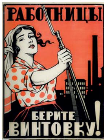
Figura 2 - Mulheres Trabalhadoras, Ergam as Vossas Vossas Espingardas! (Cartaz Alusivo à Revolução Russa), Artista: Lev Brodarty. Ano: 1918. https://fflc.org.mz/eng/Gallery/2017/Outubro/OUTUBRO-1917-RUSSIA

A partir da Revolução de 1917, a Rússia passou a ser conhecida como a União das Repúblicas Socialistas Soviéticas (URSS). Os líderes e os objetivos da Revolução Russa foram os seguintes: